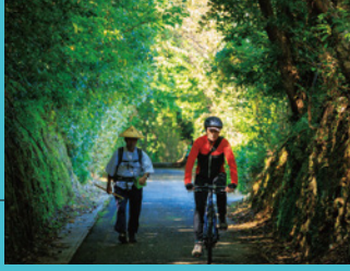
以布利分岐～大岐海岸 以布利分岐から大岐海岸までの四国通路ルート。木々のトンネルを抜ける山道からは、森林越しに大岐海岸の絶景も楽しめる。E-bike で周遊する最適ルート。