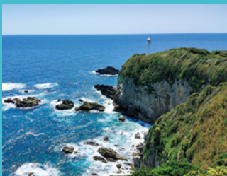
足摺岬 四国最南端で地球の丸さを再認識。