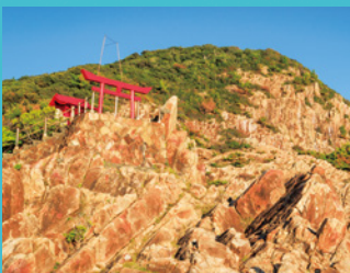
竜宮神社 地元漁師が海の女神を祀る神社のロケーションに仰天！