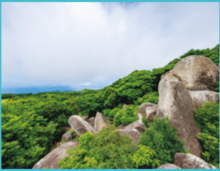
唐人駄場巨石群 先史時代の巨石群の上に巨大な岩の露頭から、壮大な太平洋を眺めてみませんか？