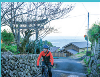
松尾 美しい漁港エリアを散策。徒歩でも自転車でも OK！