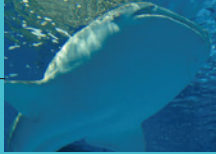
大阪海遊館 以布利センター 大阪の「海遊館」がジンベエザメを飼育している研究施設。