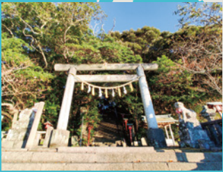
鹿島神社 小さな島にある美しい神社。ピクニックに最適！