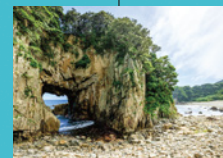
白山洞門 絶景スポットの天然巨大洞門